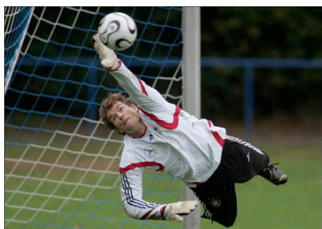
Nicht nur im Tor gute Manieren: Jens Lehmann